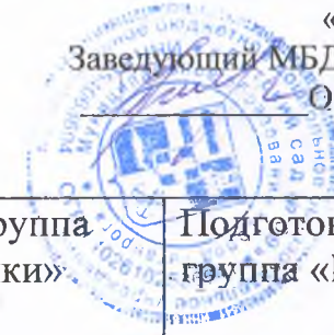
График проведения утренней гимнастики